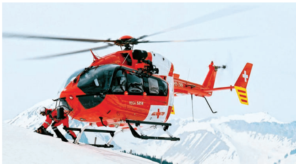
Auch das Unternehmen EADS Eurocopter kann im Zuge der MC-Studienreise besucht werden.

Mehr als 200 Experten werden am 15. und 16. Juni 2005 zum ersten grenzüberschreitend organisierten Mechatronik Forum nach Augsburg kommen. Aktuelle Entwicklungen in einer der Schlüsseltechnologien des neuen Jahrtausends werden von 50 Referenten namhafter Unternehmen und Organisationen mit den teilnehmenden Entscheidungsträgern diskutiert. Die Bandbreite reicht von Antriebssystemen bis zur Werkzeugmaschine, von Selbstoptimierenden Systemen bis zur Simulation. Im Vordergrund steht bei allen Beiträgen der konkrete Anwendungsbezug, das heißt, alle aktuellen Entwicklungen werden vor dem Hintergrund ihrer